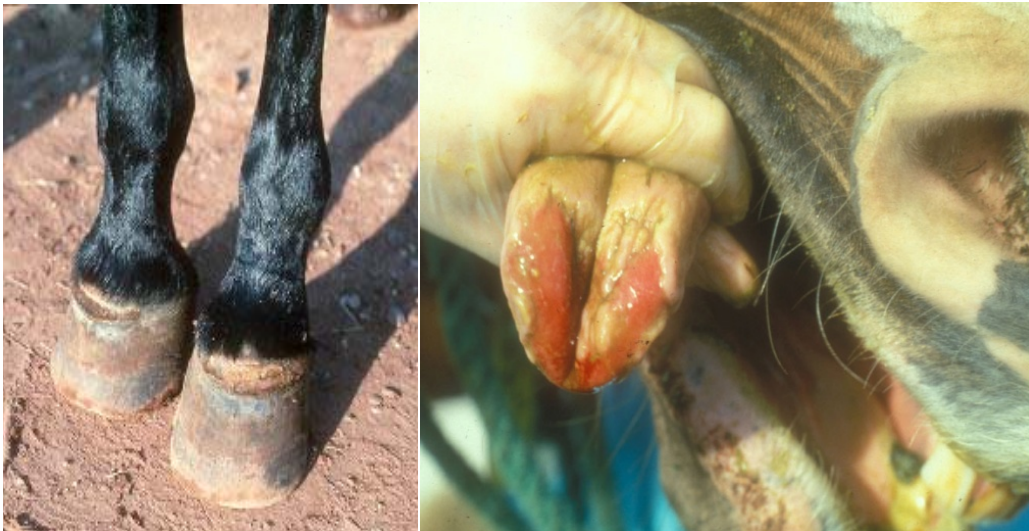
جراحات حاصله از ویروس تورم تاولی دهان در مخاط زبان (شکل راست) و تاج سم (شکل چپ) اسب مبتلا

بروز جراحات تاولی در مخاط دهان، لثه‌ها، زبان، لب‌ها، منخرین، سم‌ها و نوک پستان حیوانات مبتلا که بعد از مدتی بافت خراشیده، متورم، خونین و دردناکی از خود باقی می‌گذارند از علائم این بیماری است. حیوانات مبتلا از خوردن آب و غذا امتناع کرده، از تب ملایم، کاهش شدید وزن بدن و امکان وجود لنگش رنج می‌برند.